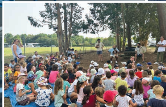
"Moun en Fanfare"

Cet équipement favorise et facilite le déplacement à vélo.