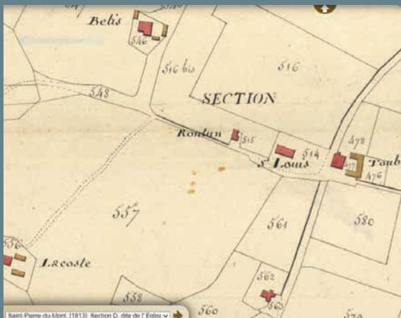
Le cadastre de 1816 (Archives départementales)

Route de Haut-Mauco, repérez le grand château d'eau après être passé sous le pont de la rocade : sur la droite, se dresse la maison Tout Blanc, une bâtisse du XIX e siècle à laquelle est accolée une grange et une maison d'habitation appelée : « Routin ».