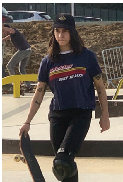
> Shani Bru

« Un chantier plein de curiosité que j'ai eu la chance de suivre en tant qu' élu. Un passage tous les matins pour voir l'évolution du chantier, voir ces hommes de ZUT-SKATEPARKS plein de talents, la mise en place des ferrallages, des coffrages bois et acier réalisés sur place pour la création des modules et du bowl. Le bowl justement est une œuvre d'art réalisée sur place par des hommes de talent, pratiquants et amoureux de ce sport. Ils ont façonné le béton à la force du poignet avec des bouteilles d'eau à cause de la chaleur et des taloches pour le rendre lisse et skatable. Ce lieu devient un terrain de glisse pour tous les amoureux experts et débutants de toute la région, tel que Shani Bru championne de France 2015 vice-championne d'Europe en 2017 une belle reconnaissance pour Saint Pierre-Du-Mont. Merci à tous ! »