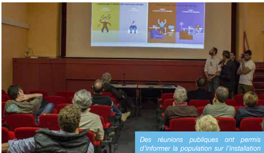
Des réunions publiques ont permis d'informer la population sur l'installation de la fibre optique dans les quartiers

Trois réunions publiques d'information sur l'arrivée de la Fibre optique via l'opérateur Orange, ont été organisées dans la commune de Saint-Pierre-du-Mont.