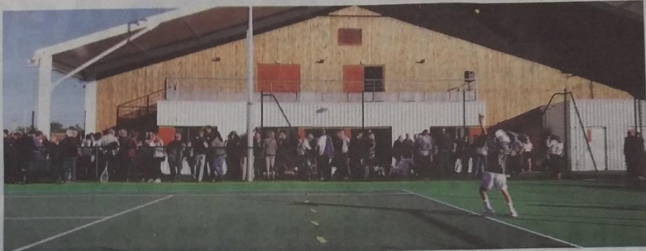
Les jeunes joueurs ont testé les nouveaux courts de tennis dès le début de l'inauguration.