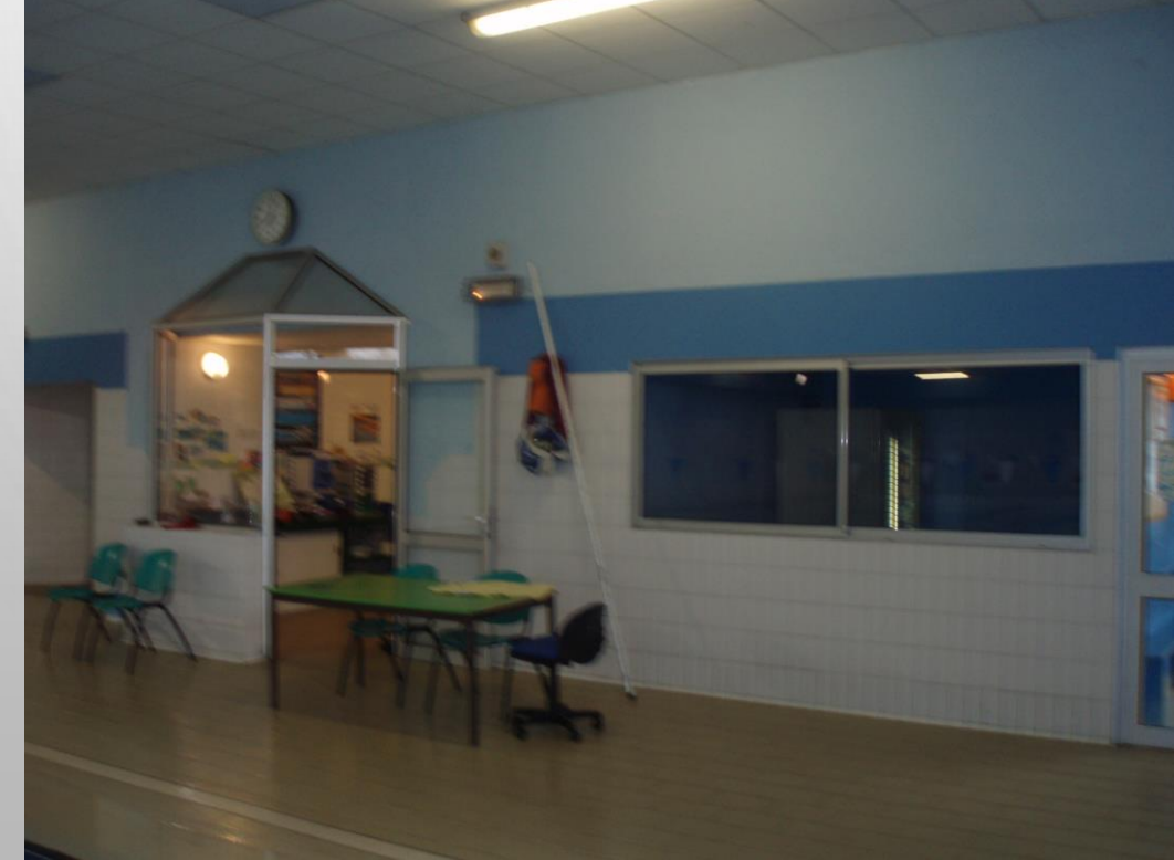
Piscine Municipale avant travaux